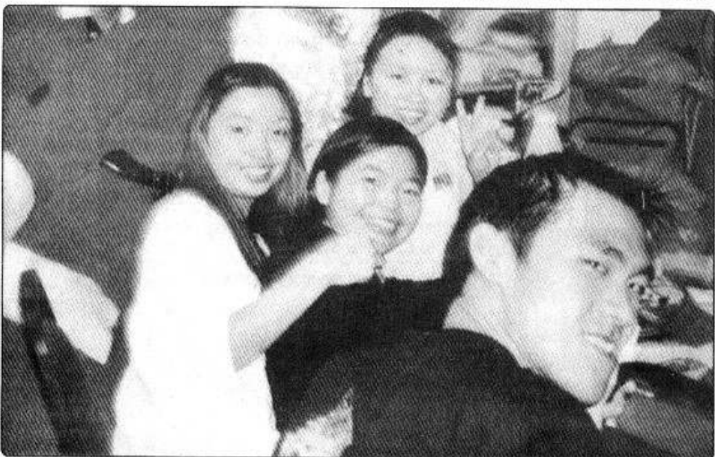
கல்லூரியில் பயிலும் மாணவர்கள்

3 மாடிக் கட்டடத்தைக் கொண்டிருக்கும் இக்கல்லூரியில் இப்போது 21 நாடுகளைச் சேர்ந்த மாணவர்கள் தங்களது மேற்கல்வியை மேற்கொண்டு வருகின்றனர். இக்கட்டடத்தில் ஒரே நேரத்தில் 2,000 மாணவர்கள் படிக்கக்கூடிய வசதிகள் உண்டு. 15 வகுப்பறை, 6 கணினிக் கூடங்கள், நூல்நிலையம் படிக்கும் அறை என்று தனித்தனி அறைகள் மாணவர்களின் வசதிக்கேற்ப பிரித்து வழங்கப்பட்டிருக்கிறது. இவர்களுக்குப் போதிக்கும் பேராசிரியர்கள் மற்றும் விரிவுரையாளர்கள் அந்தந்தக் கல்வித் தரத்துக்கு ஏற்றவாறு நிபுணத்துவம் பெற்ற அனைத்துலக பல்கலைக்கழகங்களிலிருந்து